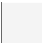
Cool White Ref 1502