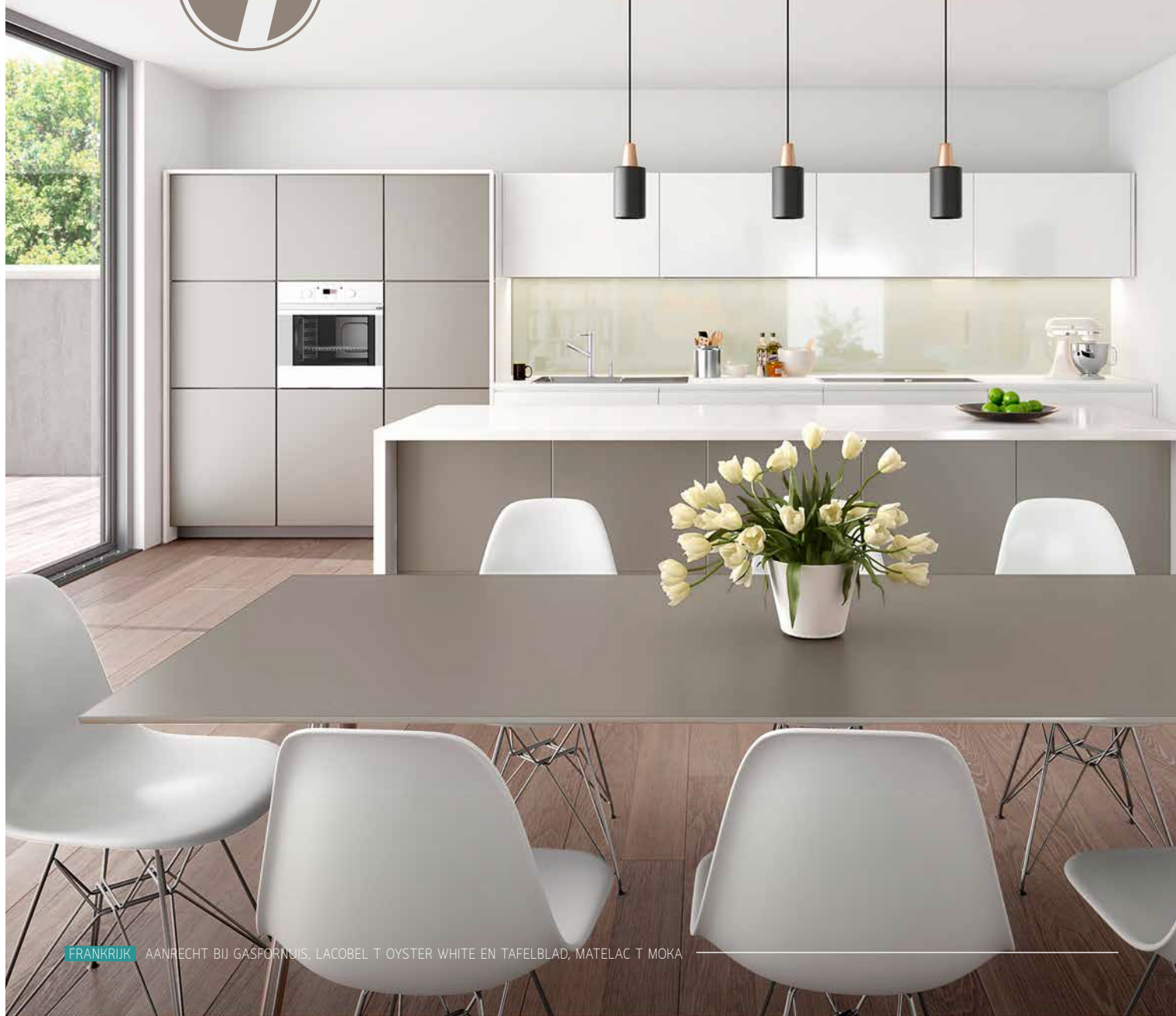
FRANKRIJK AANRECHT BIJ GASFORNUIS, LACOBEL T OYSTER WHITE EN TAFELBLAD, MATELAC T MOKA