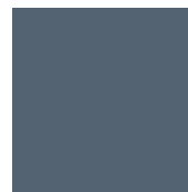
Zen Grey Ref 6005