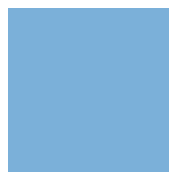
Light Blue Ref 1413