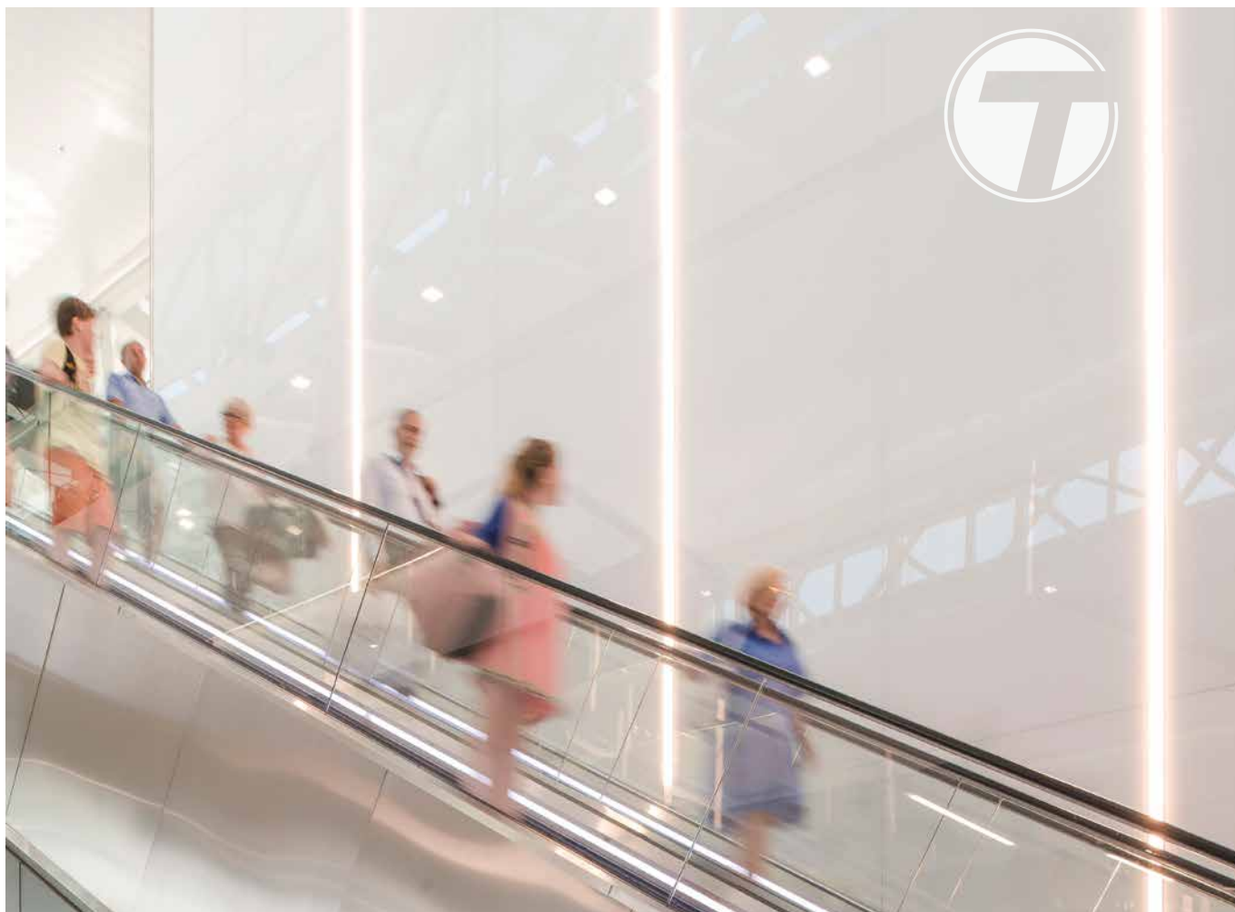
BELGIË LUCHTHAVEN BRUSSEL, WANDBEKLEDING, LACOBEL T COOL WHITE